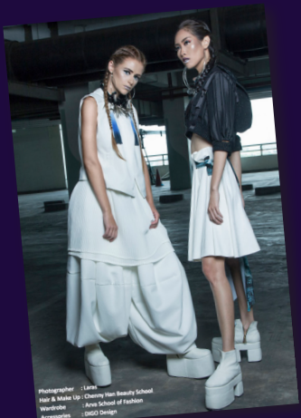
Hair & Make Up : Chenny Han Beauty School Wardrobe : Arva School of Fashion Accessories : Irena Design

Agenda-acenda acara yang dihadirkan dalam acara ini antara lain seperti seminar dan demo make up, seminar fotografi, Junior Fashion Designer Competition (JFDC) 2017, kompetisi berhadiah beasiswa untuk bersekolah di ARVA School of Fashion, kompetisi desain produk, hingga fashion show karya desainer-desainer muda Surabaya.